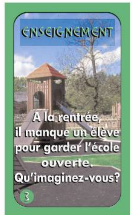
Exemple de cartes de situation